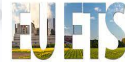
AB ETS Sektörleri (2030)

Sektör ve emisyona kapsamı genişleyebilir